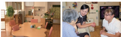
●食堂・デイルーム 家庭的な雰囲気の中で、お食事やおしゃべりなどしながら、日中の多くの時間を過ごせます。ケアもここで進められることが多くなります。

その人らしく自由に時間を過ごせる個室（プライベートゾーン）、そして隣接するダイニングリビング（セミプライベートゾーン）は、入居者同士が食事や談話をしながら、なじみの関係を形成する憩いとくつろぎの空間です。