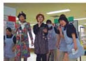
美女2人の司会で お誕生会はいつも大盛況です

などのあたたかいお言葉、笑顔を頂いています。(こちらこそありがとうございます) 今後もスタッフ一丸となり、デイケアの日を心待ちにして頂けるように「安心・真心・ふれあい・笑顔」を利用者様にお届けし、心身機能の維持、向上やご家族様の身体的・精神的負担を軽減する事に努めていきます。