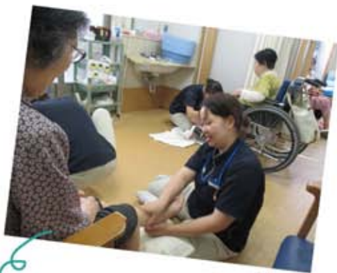
足の血行促進!今夜はぐっすり眠れそう!