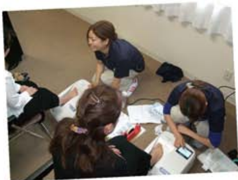
健康チェック!あなたの骨密度は大丈夫?