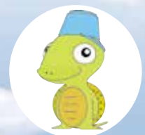
村上病院キャラクター 「むらかめくん」